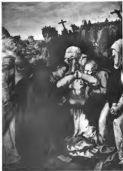
Die ägyptische Maria.